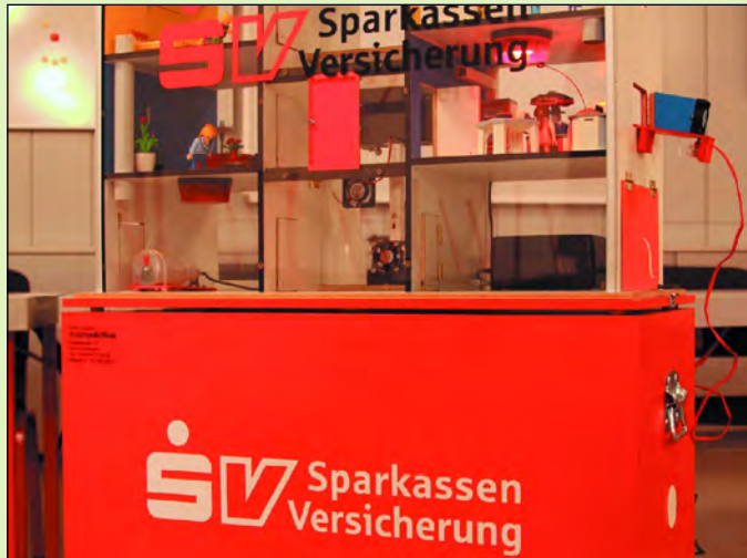
Rechts am „Gebäude“ der Kleinlüfter zur Entrauchung

Das vierstöckige Rauchhaus ist gefüllt mit moderner Technik und vollständig eingerichtet wie ein Wohnhaus, die Räume und