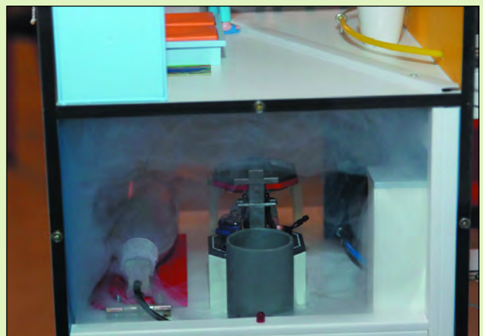
Die Küche des Hauses mit dem Raucherzeuger