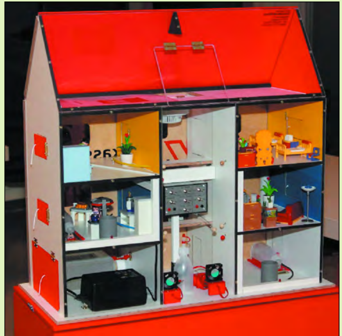
Das Rauchhaus mit seiner elektronischen Steuerung