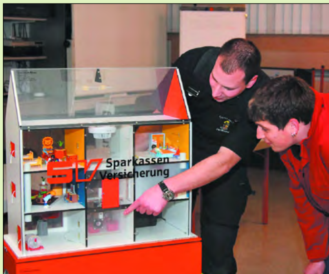
Auch die Mitglieder der Jugendfeuerwehr waren von dem Rauchhaus begeistert und ließen sich sofort gespannt die Möglichkeiten und Gefahren der Rauchausbreitung erklären